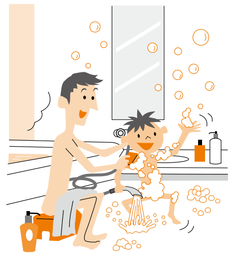
2007年 INAX 調べ