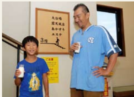
写真向かって左から たいがくん(小4) お父さん

今日は、僕とお父さんとおばあちゃんの3人で、銭湯に来ました。月にだいたい1回は来るかなあ…。お昼過ぎのすいてい時間帯をねらって来ます。だって、ひろ〜いお風呂が、さらにひろ〜く感じるでしょ(笑)。それとね、人が少ないとお父さんといろんな話ができるのもいい。だってお父さん、ふだんは仕事が忙しくて、家にいないんだもん。学校のこと、スイミング教室のこと、友達と遊んだこと…。僕の話を、お父さんはニコニコしながら聞いてくれます。